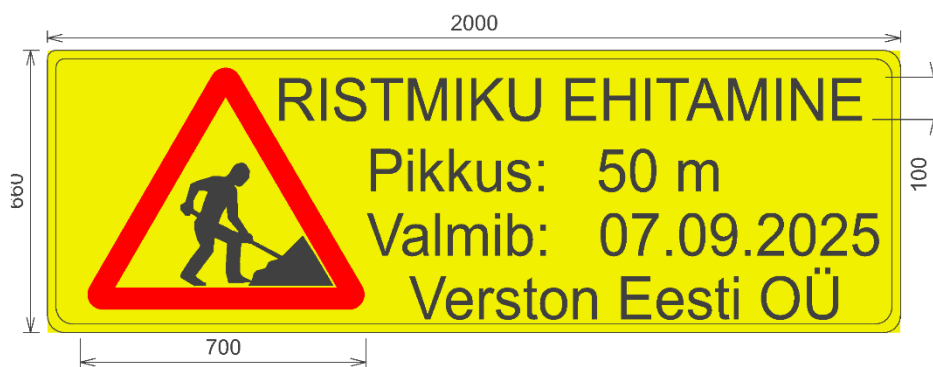
Joonis 3-1 Kõrvalmaantee 2010 595a Ajutise liikluskorralduse teave

Märk 595b Ajutise liikluskorralduse teostajate teave paigaldatakse metallpostil, kohtkindlalt, tee teljega rööpselt. Kollane kile on valgust mitte peegeldav, mustade tähtede kõrgus 25 mm. Joonisel mõõdud mm.